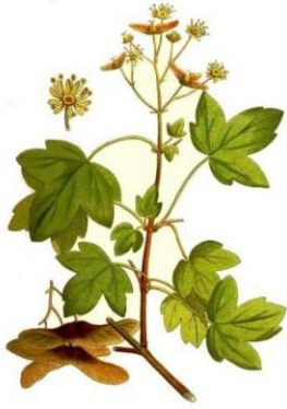
ACER CAMPESTRE L.